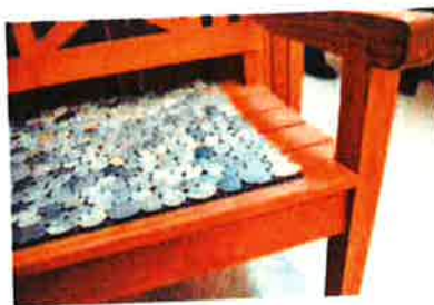
En bænk med en måtte af flade sten giver en sanseoplevelse.