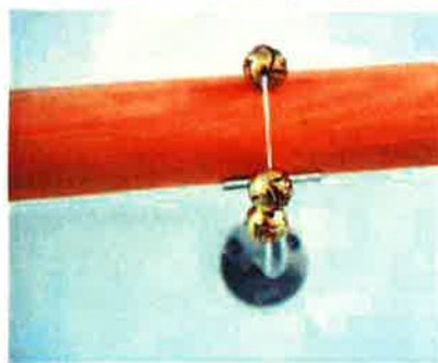
Der er gelænder i hele huset. Ud for hver beboers dør er der et særligt tegn, så man ved, hvornår man er kommet hjem. Her er det for eksempel kugler.

"Så har vi det at snakke sammen om. De kommer med et kæmpe smil og roser på kvinderne." •