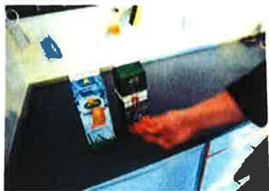
Personalet hjælper beboerne med at bruge sanserne til at føle sig frem og vælge selv – fx i form af elastikker på drikkevarerne.