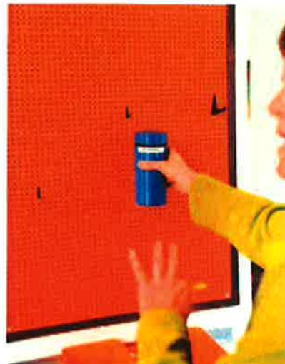
En tavle med konkreter: Hver ting betyder en aktivitet, og beboerne kan selv vælge mellem to ad gangen.

› "Vi ændrer selvfølgelig procedurer, hvis det er hensigtsmæssigt, men lige så snart man har forstået, hvorfor strukturerne er vigtige, falder det meget naturligt at følge dem," fortæller Annette.